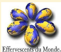
Effervescents du Monde.

Date limite d'inscription : 26 octobre 2023 Date du concours : Du 28 au 30 novembre 2023